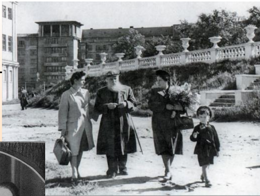
около Оперного театра